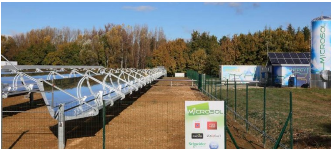
Figure 6 : Système d'électrification pour l'Afrique à base d'énergie renouvelable pour un groupe d'habitation, village ou communauté agricole

Les deux approches, larges infrastructures et électrification individuelle, sont donc toutes les deux limitées. Le modèle intermédiaire d'électrification latérale suppose de concevoir et de déployer à grande échelle un nouveau modèle d'électrification progressif et modulaire, reposant sur les énergies renouvelables, les nouvelles technologies de l'information et de la communication et les ressources humaines locales (figure 6). Comme elle l'a déjà fait de manière spectaculaire pour ses infrastructures de télécommunication, l'Afrique pourrait aujourd'hui sauter une étape technologique en se détournant du modèle d'électrification centralisée du 20 ème siècle pour développer directement les infrastructures électriques décarbonées, décentralisées et intelligentes, telles que les communautés d'énergie, dont les pays industrialisés rêvent aujourd'hui. Ce modèle nommé l'électrification latérale [8] ressemble fortement au modèle de l'électrification des communautés énergétiques vue précédemment d'un point de vue technologique.