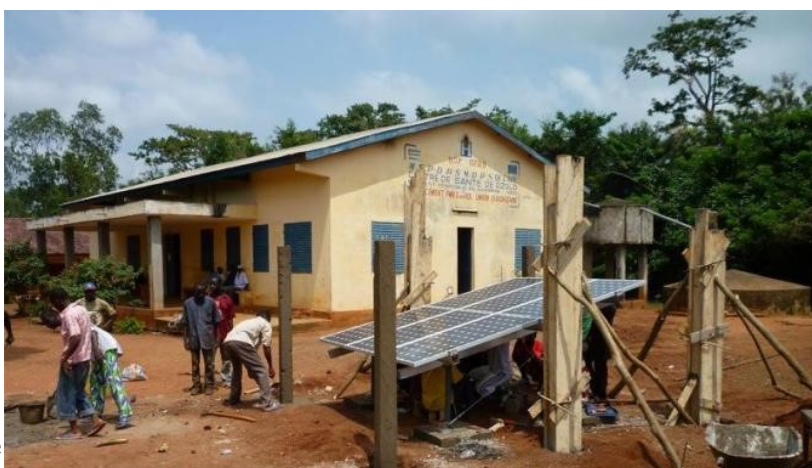
Figure 5 : électrification individuelle au Sénégal.

Couvrant une large gamme de prix et de niveaux de service, ils ont en commun d'être conçus pour couvrir des besoins de base, de familles ou petits commerçants, indépendamment de tout réseau (figure 5).