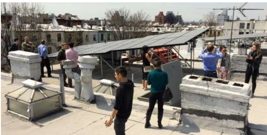
Figure 4: Des habitants de Brooklyn ont créé leur micro-réseau d'énergie verte, facilité grâce à la technologie « blockchain ».

La première étape a consisté à créer un marché local d'énergie. Il s'agit de permettre d'échanger de l'énergie et de lui attribuer un prix, de façon directe et locale. Pour cela, il a fallu multiplier les compteurs intelligents ( smart meters ) et valoriser l'énergie produite localement grâce à un système de jetons (tokenisation). Si un producteur/consommateur produit davantage d'énergie verte qu'il n'en consomme, alors il dispose d'un excédent d'énergie. Ce surplus est revendu sur le réseau, en échange de jetons. Ces jetons sont ensuite échangeables localement. Ils constituent une monnaie locale d'énergie, avec un fonctionnement similaire à d'autres monnaies locales classiques, non virtuelles.