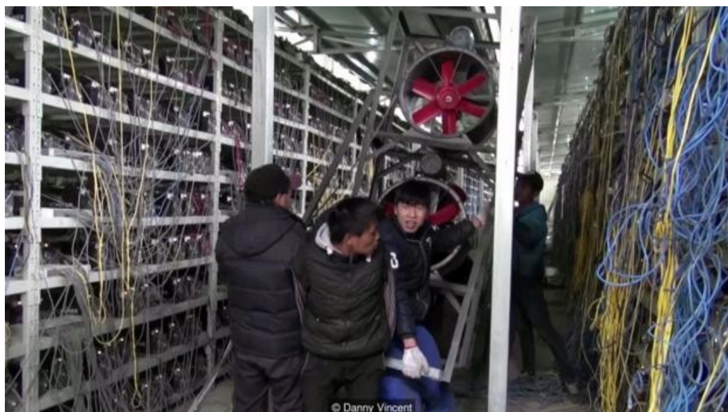
Figure 2: Une ferme de minage en Chine. Source .

pratique montre que le « minage » est devenu un marché très compétitif et qu'il est désormais essentiellement réalisé par d'immenses fermes de minage qui regroupent une forte capacité de calcul dans des pays où l'électricité est disponible à bas prix, Islande ou Chine, par exemple (figure 2).