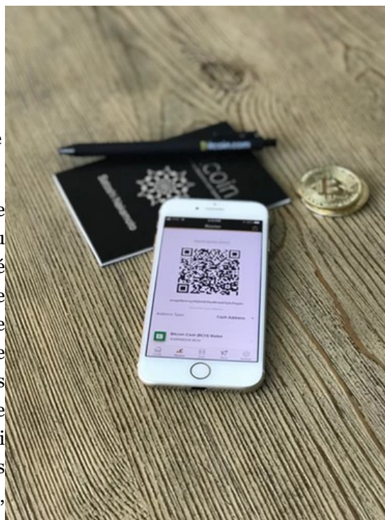
Figure 1: Création des bitcoins en 2008 suite à la chute de la banque d'investissement Lehman Brothers

En tant que monnaie ou commodité, les bitcoins peuvent être échangés contre d'autres monnaies ou commodités, biens ou services. Le taux d'échange de la cryptomonnaie est fixé principalement sur des places de marché spécialisées et fluctue selon la loi de l'offre et de la demande. Le système fonctionne sans autorité centrale, ni administrateur unique, mais de manière décentralisée grâce au consensus de l'ensemble des nœuds du réseau. Les transactions en cryptomonnaie effectuées sont validées grâce à des ordinateurs qui appartiennent à des « mineurs » qui sont eux même rémunérés en bitcoin. Selon le Cambridge Center for Alternative Finance, « au mois d'avril 2017, la valeur de marché combinée de toutes les cryptomonnaies est de 27 milliards de dollars », une valeur comparable, selon l'étude, à celle d'entreprises de la Silicon Valley telles qu'Airbnb.